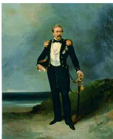
《バルスレイケン像》 明治期 カンバス・油彩、 65.2×53.1cm、 公益財団法人日動美術財団蔵 ※勝海舟旧蔵、海軍伝習所で海舟らを 指導したオランダ軍人の肖像 ※展示期間：11月25日～12月20日