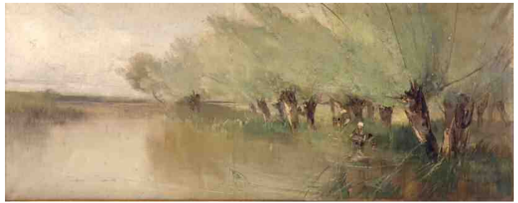
左:《ヴェニス風景》明治20～30年代、カンバス・油彩、58.6×118.4cm、新発田市蔵 ※2013年に発見された作品