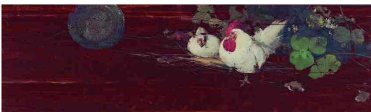
《鶏図》明治期、板・油彩、40.0×133.0cm、福井家蔵