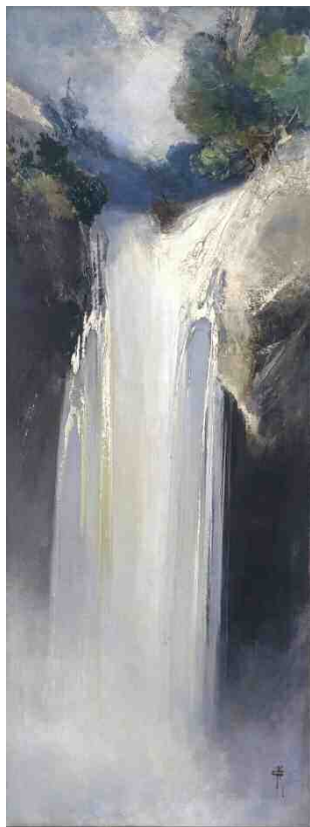
《滝》大正～昭和初期、カンバス・油彩、 198.0×73.0cm、平塚市美術館蔵