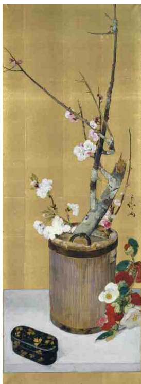
《梅と椿の静物》1929年以前、絹本油彩、 123.0×44.0cm、三重県立美術館蔵