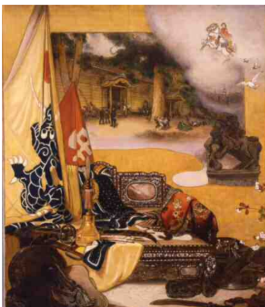
《振天府下図》 1931年以前、 カンバス・油彩、 71.2×60.7cm、 明治神宮蔵 聖徳記念絵画館(明治神宮外苑)の 壁画のための下図