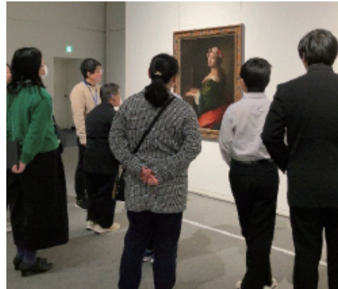
令和7年度の実施例：左・真ん中 濁川小学校 | アートカードを使った事前授業の様子 右 新津第二中学校 | 来館授業の様子