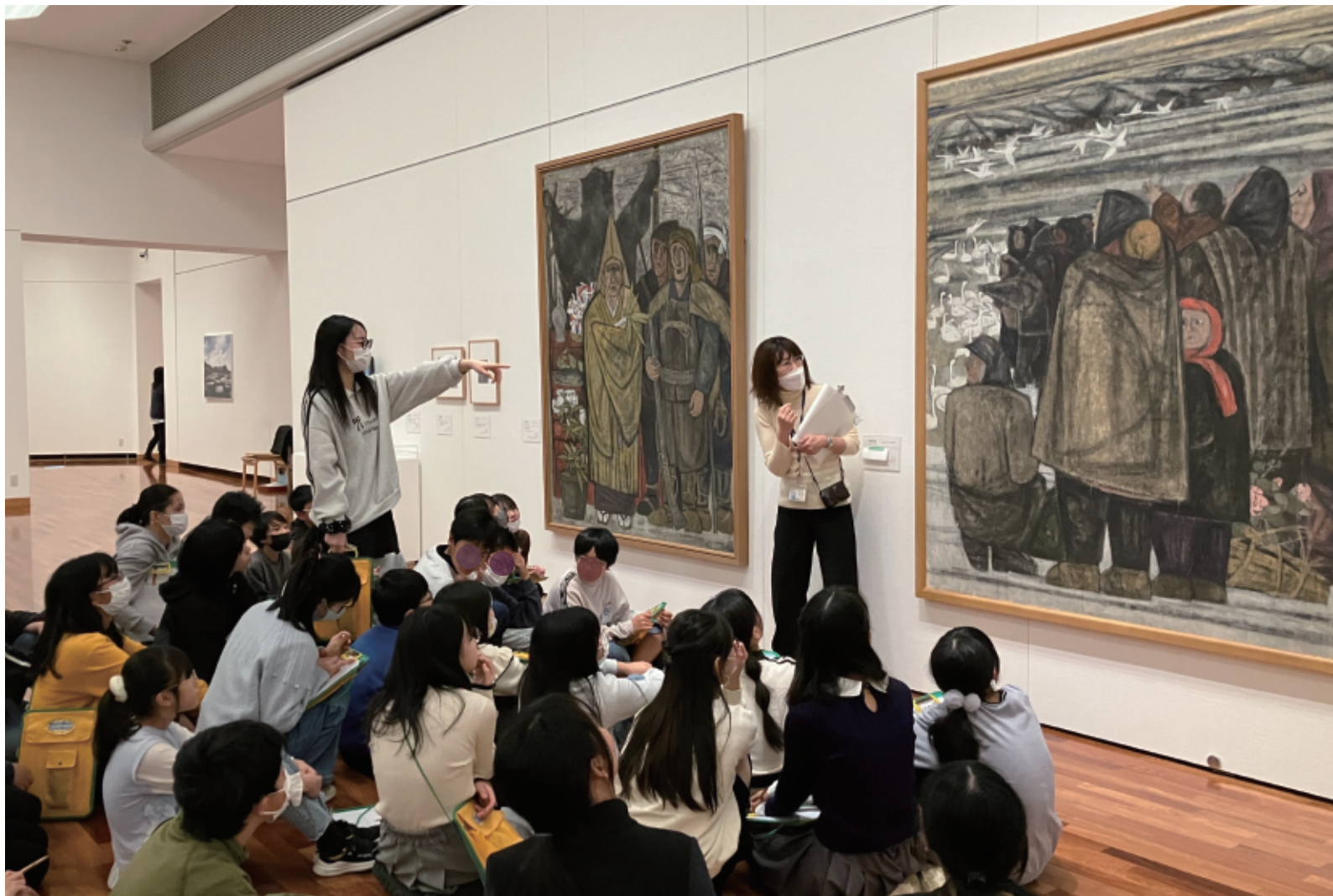
令和7年度の実施例：「アートリップ2025」濁川小学校 | 来館授業の様子