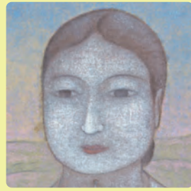
秦テルヲ《瓶原(みかのほら) 母子像》1923年(部分)