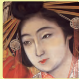
小西長廣《太夫の図》大正中期(部分)