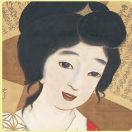
樋口富麻呂《女》1915年頃(部分)