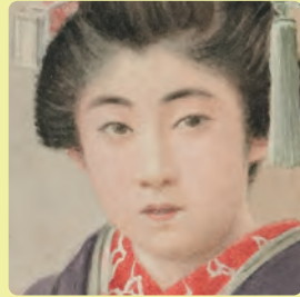
作者不詳(Tani)《客を迎える少女》明治後期(部分)