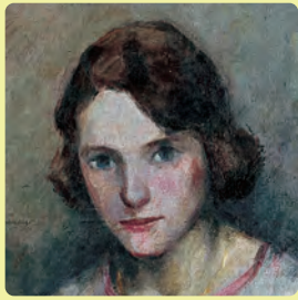
跡見泰《田舎の娘》1923年(部分)