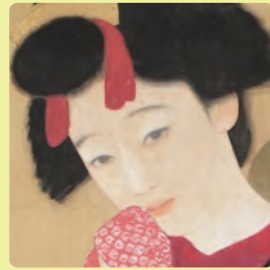
樋口富麻呂《女》大正初期(部分)