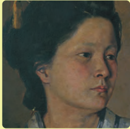
佐久間文吾《団扇をもつ少女》1888年(部分)