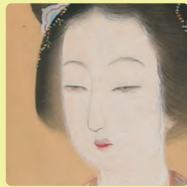
増原宗一《雪雪花幻想》中幅、大正末期(部分)