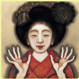
岡本神草《拳の舞妓》1922年頃(部分)