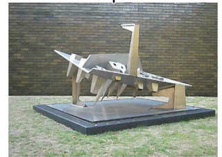
渡邊利尭 「早（ヒデリ）」 1994年

※野外彫刻の散歩道への出入りには、「海の庭」の扉、または美術館入口脇の扉をご利用ください。