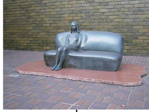
峯田義郎 「部屋の中の午後（一人）」 1988年