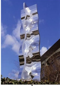
建畠覚三 「WAVING FIGURE」 1985年