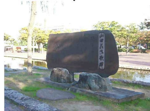
山田花作 歌碑 柳散る 秋の西堀東堀 さびしきころよ 恋のみなとも