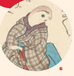
1. 歌川国芳「新板猫の温泉」 2. 歌川国芳「流行猫の曲舞」 3. 歌川国芳「猫の百面相 忠臣蔵」 4. 山東京山作・歌川国芳画「朧月猫の草紙」六編表紙、いずれも個人蔵 5. 歌川国芳「胸くらへ盤上太平棋」部分 6. 歌川国芳「つくものけん」部分、いずれも名古屋市博物館蔵(高木繁コレクション)