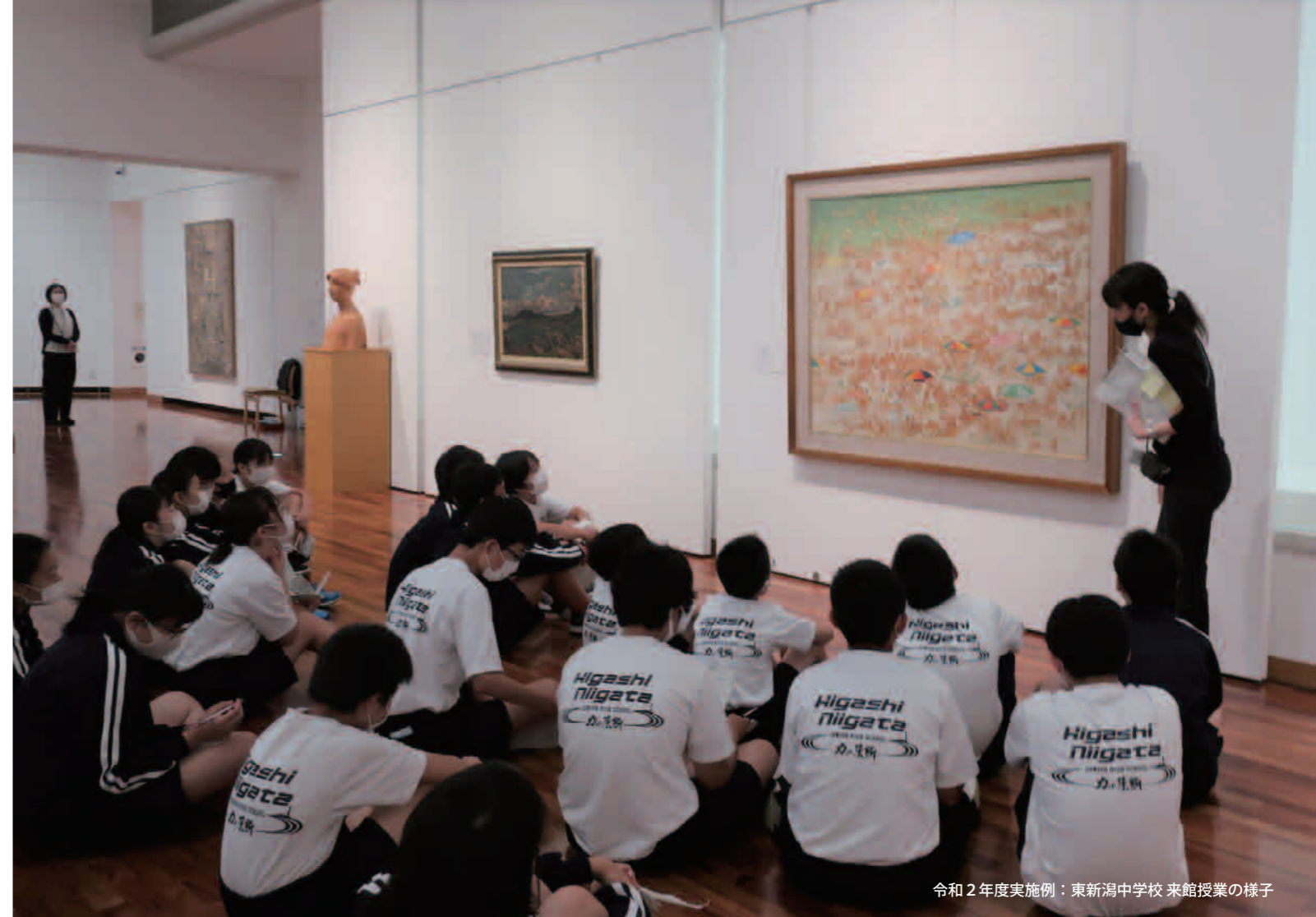
令和2年度実施例：東新潟中学校 来館授業の様子