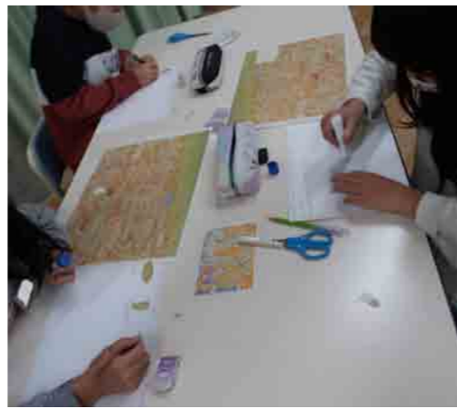
両川小学校 | アートカードを使っでのワークショップ