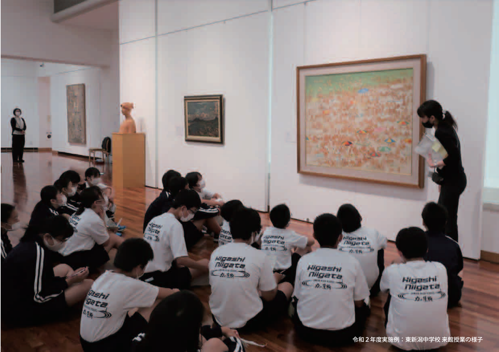
令和2年度実施例：東新潟中学校 来館授業の様子