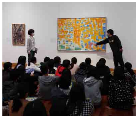
黒崎南小学校 | コレクション展の対話型鑑賞