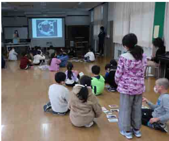
令和2年度の例：新津第二小学校 | スクリーンでの対話型鑑賞