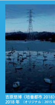
吉原悠博《培養都市 2018》2018年 (オリジナル: 2015年)

コレクション展Ⅱ LANDSCAPE 水土の作家 × NCAM コレクション 水と土の芸術祭 2018 にちなみ、作家それぞれの「土地に対する視点」、すなわち「LAND 'SCAPE」(風景)をテーマに、現在に至る水と土の芸術祭出品作家の作品と新潟市美術館のコレクションを取り合わせて構成します。