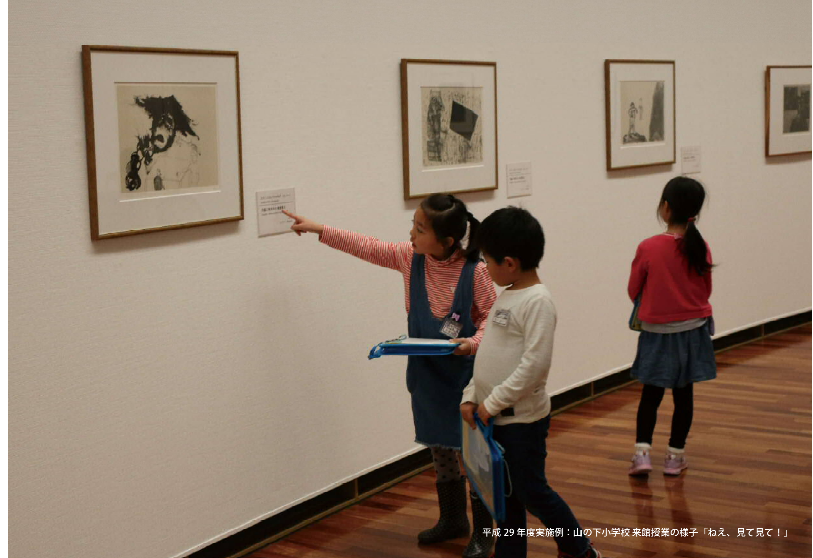
平成 29 年度実施例：山の下小学校 来館授業の様子「ねえ、見て見て！」

30周年を機に誕生した館内フリーコーナーでいつでもだれでも気軽に参加できる造形メニューもご用意しています