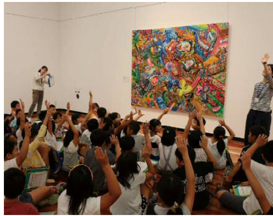
平成 29 年度の例：東新潟中学校 | 大きなアートカードでグループワーク