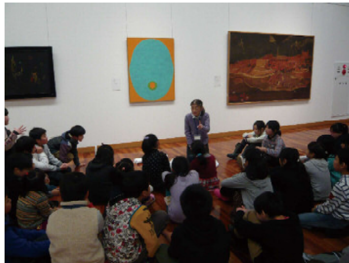
潟東東小学校 来館授業の様子 | 絵の中にかくれんぼして詩を書こう。先生が実演