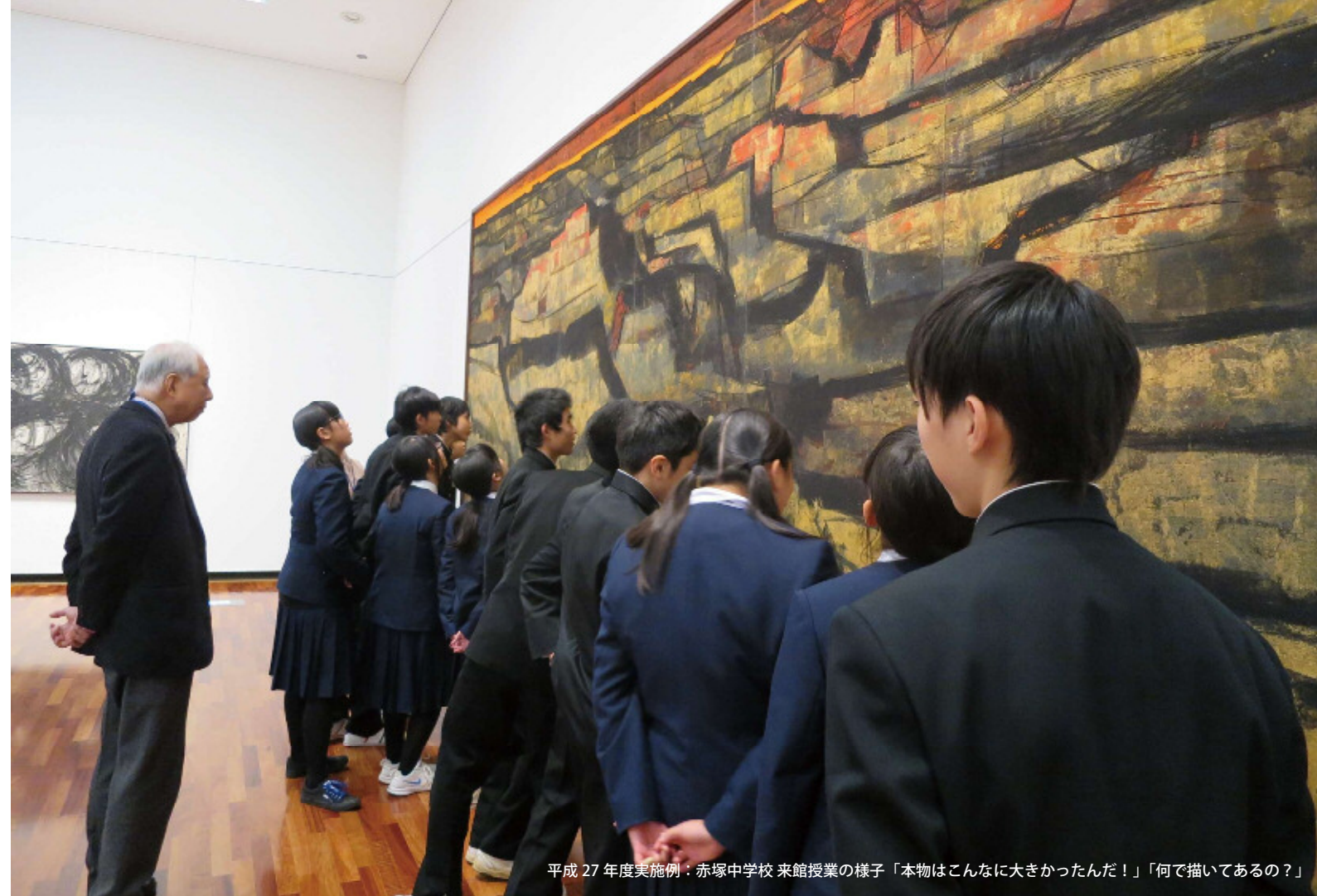
平成27年度実施例：赤塚中学校 来館授業の様子「本物はこんなに大きかったんだ！」「何で描いてあるの？」

30周年を機に誕生した館内フリーコーナーでいつでもだれでも気軽に参加できる造形メニューもご用意しています