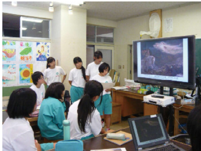
亀田西中学校 出張事前授業の様子 | グループごとに絵の中の物語を考えて発表