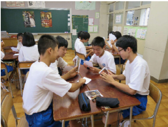
平成27年度の例：中野小屋中学校 出張事前授業の様子 | アートカードを使って