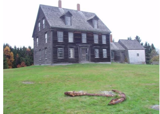
オルソン・ハウス (2009年10月撮影)