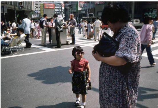
⑤牛腸茂雄《見慣れた街の中で 19》1978-80 年 (2004 年プリント) 新潟市美術館蔵