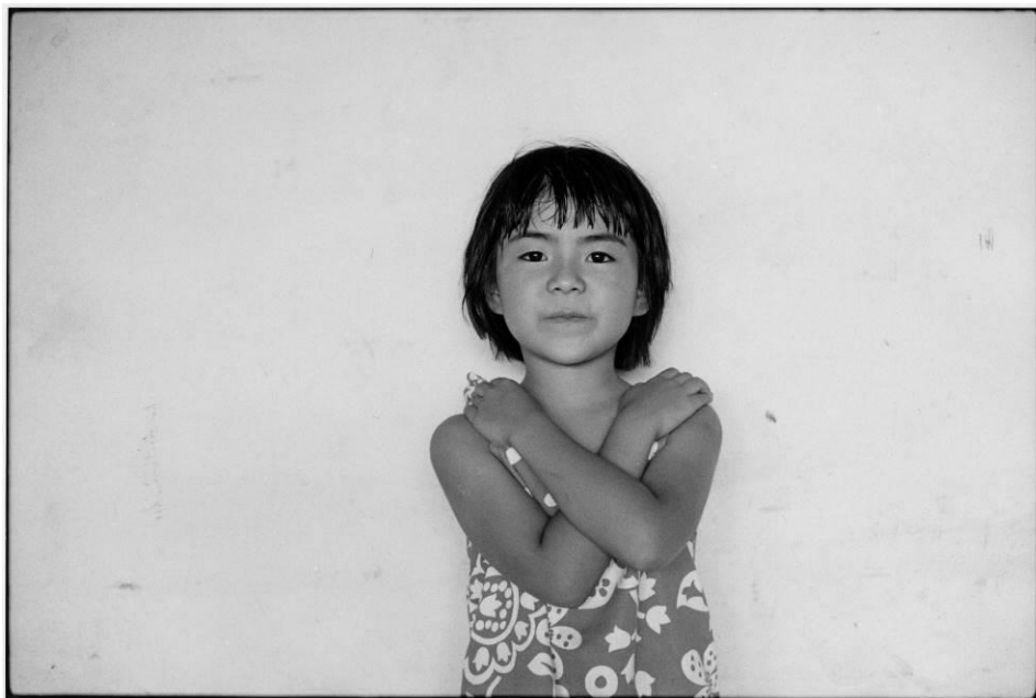
牛腸茂雄《SELF AND OTHERS 42》1977年（2023年プリント） 個人蔵