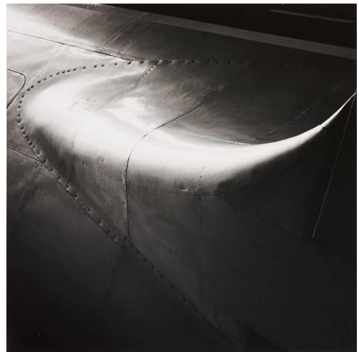
④大辻清司《航空機》1957 年 (1980 年代プリント) 渋谷区立松濤美術館蔵