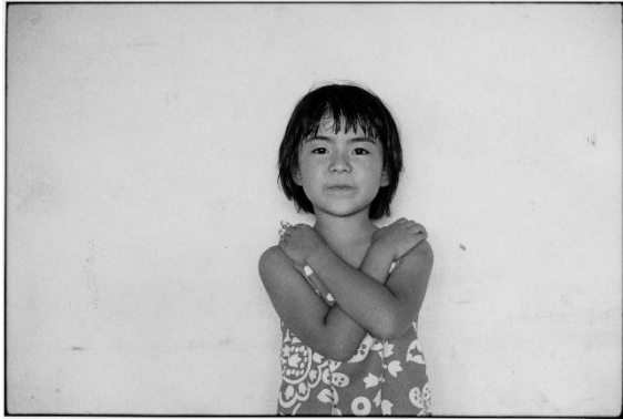
①牛腸茂雄《SELF AND OTHERS 42》1977 年 (2023 年プリント) 個人蔵