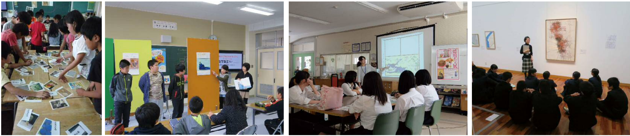
平成 28 年度の例：山の下小学校 | アートカードを使って 升湯小学校 | やなせたかし展にちなんで絵本の内容をまとめて発表 豊栄高等学校 | レクチャーを聞いて出品作品の時代背景を考える 中野小屋中学校 | 実物の印象を語り合う