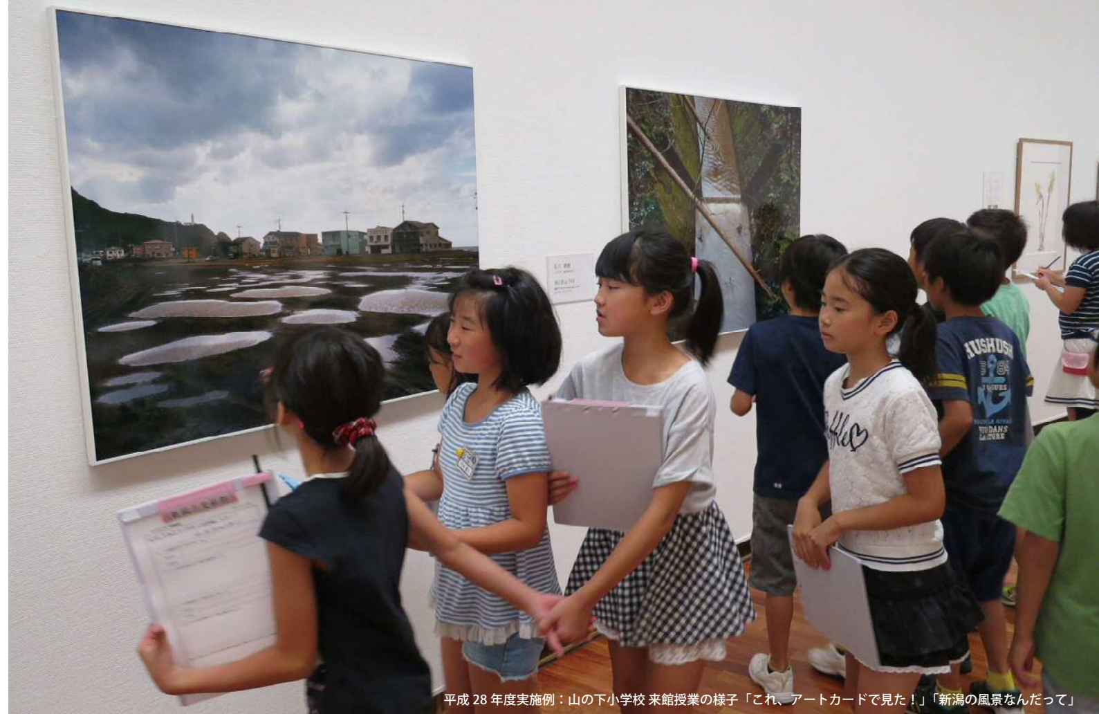
平成 28 年度実施例：山の下小学校 来館授業の様子「これ、アートカードで見た！」「新潟の風景なんだって」

30周年を機に誕生した館内フリーコーナーでいつでもだれでも気軽に参加できる造形メニューもご用意しています