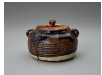
⑧「土釜『利根坊耳を作る』」 1935-44年