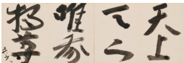
③「天上天下唯我独尊」1940年