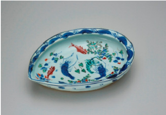
①「色絵染付鮑形鉢」1935-44年