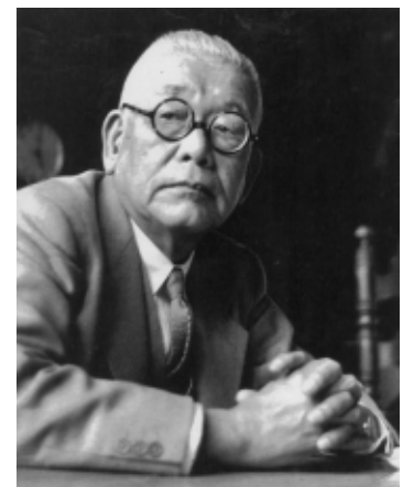
② 北大路魯山人 1955年頃

■北大路魯山人 きたおおじ・ろさんじん (1883-1959 / 本名:房次郎) 京都生まれ。15歳頃から書の才能を発揮し、書家を志して1903年上京。 翌1904年には、隸書「千字文」で第36回日本美術展覧会の書道の部で 一等賞二席を受賞するなど、次第に名を広め、書・篆刻・刻字看板の制作 で身を立てるようになります。その一方、朝鮮・中国への旅や、素封家た ちとの交流を通して美意識を磨き、1919年に中村竹四郎とともに美術骨 董の店「大雅堂美術店」を開業。1921年38歳の時には、その階上に会 員制食堂「美食倶楽部」を開きます。「美食倶楽部」はやがて料亭「星岡茶 寮(ほしがおかさりょう)」へと発展。自作の器で客に料理を供したいと考 えた魯山人が、本格的な作陶活動に入るのは40歳を過ぎてからのこと です。1936年「星岡茶寮」を退いた後も、多くの支持者を得て、北鎌倉の 窯場を拠点に陶磁器や漆器、書画の制作に励みました。