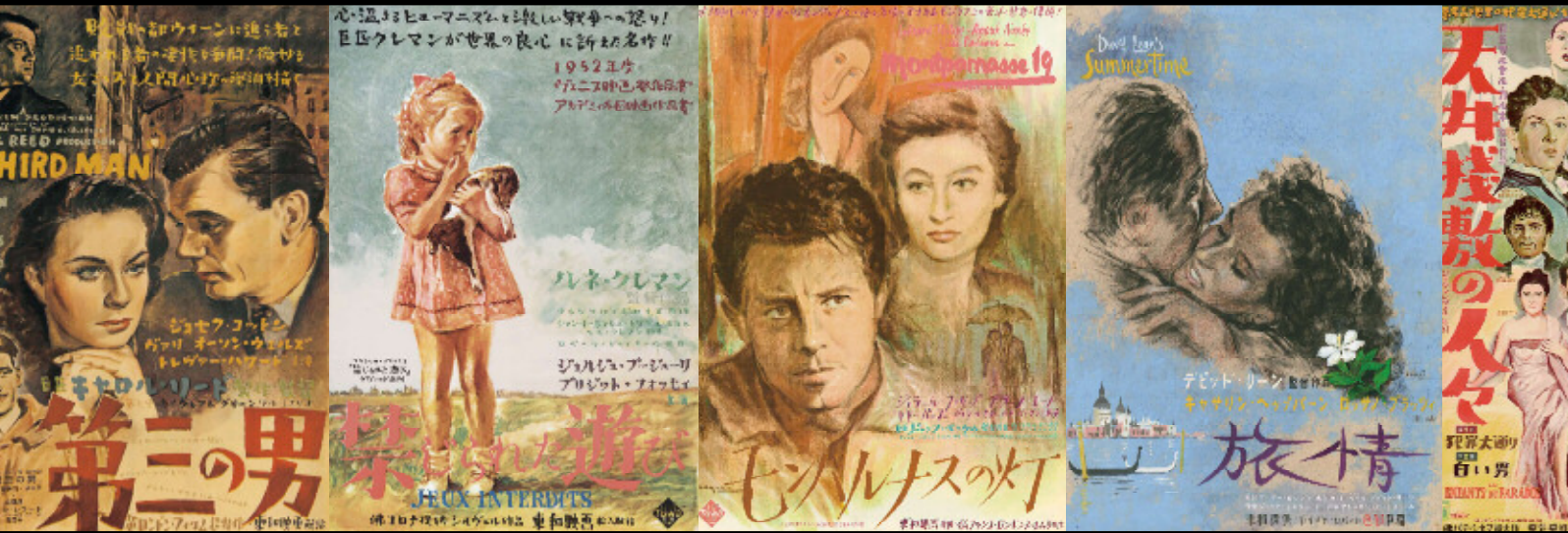
野口久光『大人は判ってくれない』ポスター（部分） 日本公開 1960年

サイレント時代から手掛けた映画ポスターの数々に、フランソワ・トリュフォーや大林宣彦も感激。 デューク・エリントンをはじめ巨匠たちと親交、ニューオーリンズ名誉市民にもなったジャズ評論家。