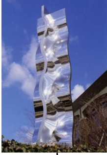
建島覚三 「WAVING FIGURE」 1985年