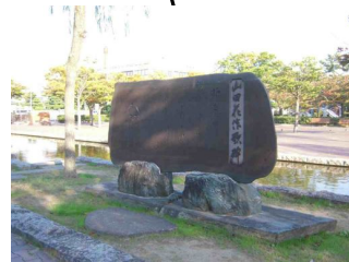
山田花作 歌碑 柳散る 秋の西堀東堀 さびしきころよ 恋のみなとも